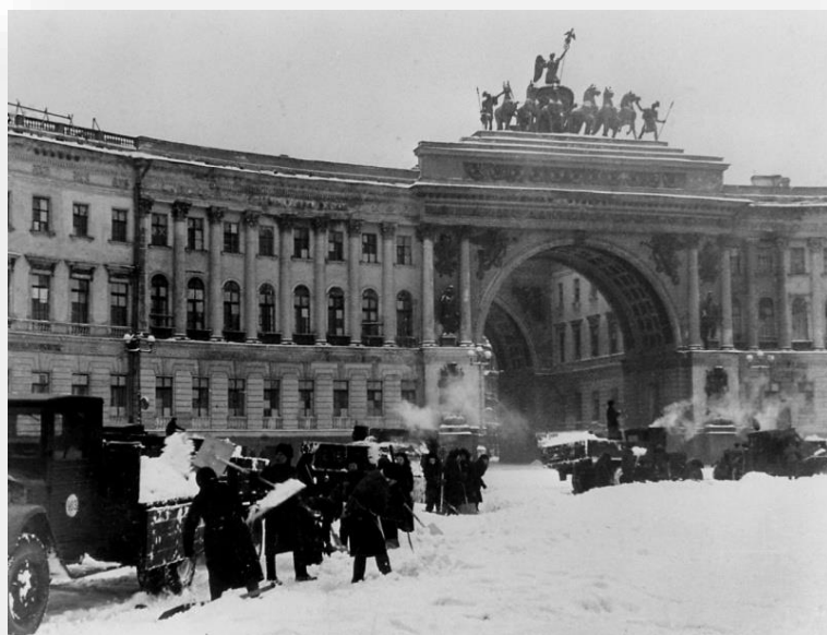
Площадь Урицкого (в настоящее время Дворцовая площадь)