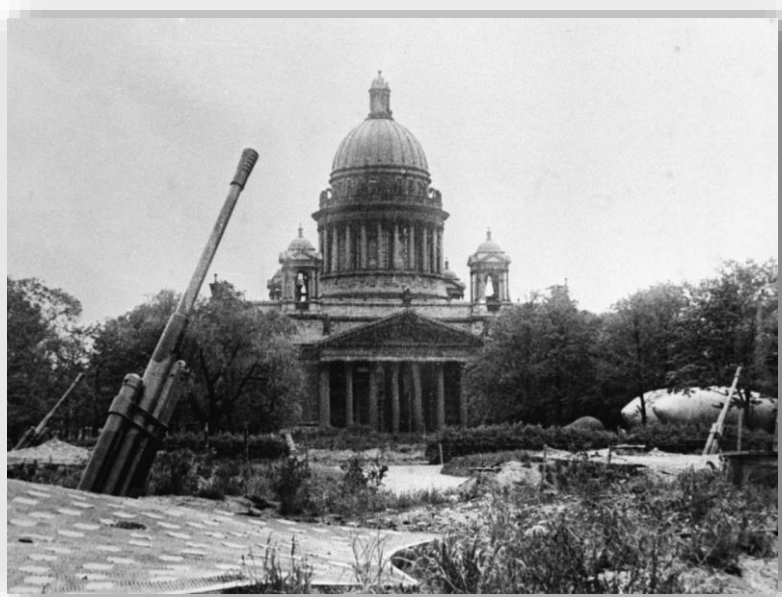
Сад Трудящихся им. М. Горького (в настоящее время Александровский сад) На заднем плане Исаакиевский собор

Вашему вниманию представлены подборка фотографий блокадного Ленинграда и фотографии тех же самых мест, улиц, площадей и т.д. сегодняшнего дня.